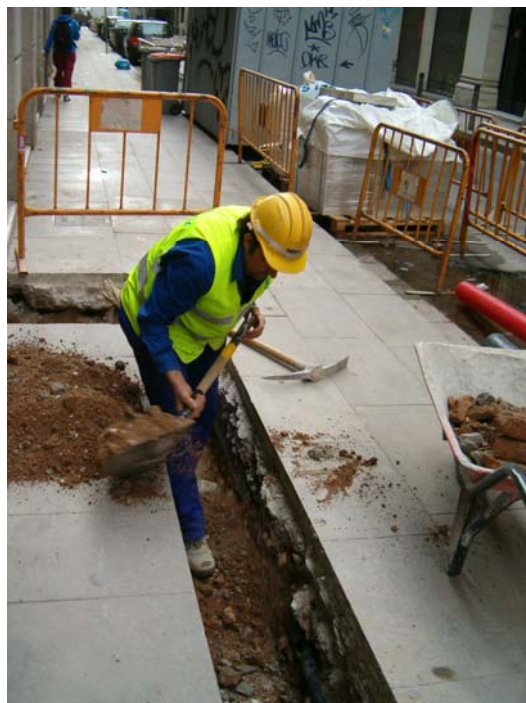
Fotografia núm. 4.

Obrer treballant amb el pic a la Rasa 100 davant del núm. 27. Fotografia efectuada mirant al nord-est.