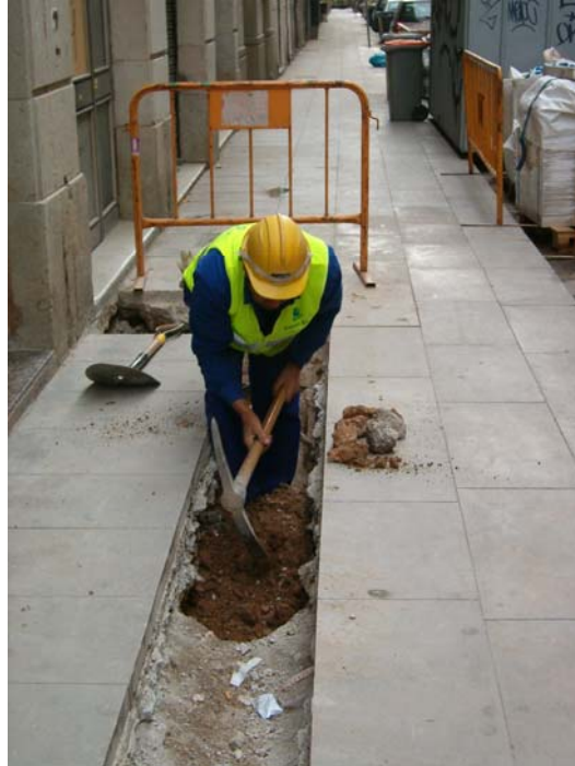
Fotografia núm. 3.

Obrer treballant amb el pic a la Rasa 100 davant del núm. 27. Fotografia efectuada mirant al nord-est.